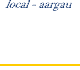
Nach 11 Tagen