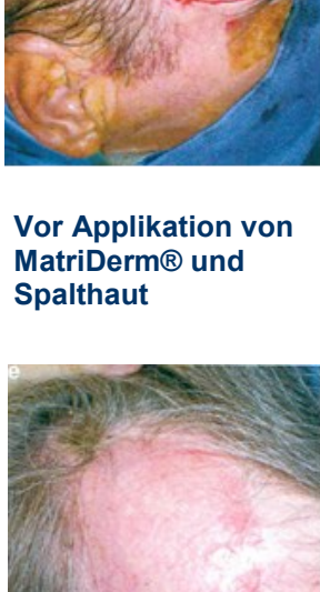
Vor Applikation von MatriDerm® und Spalthaut

In einer prospektiven Studie, durchgeführt in zwei Spitälern in Frankreich, wurden bei 28 Patienten Indikationen für MatriDerm® gestellt. Dabei wurde bei den 31 behandelten Haut- resp. Wundarealen zusammenfassend von sehr guten ästhetischen und funktionalen Ergebnissen berichtet.